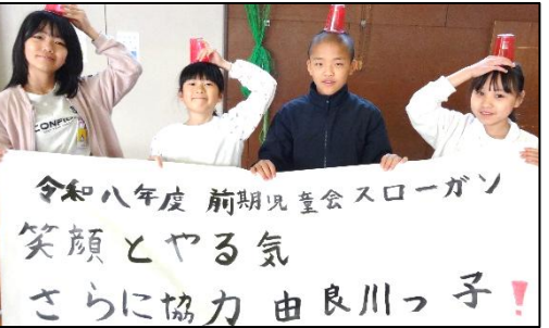
出動！由良川警察 ～前期児童会活動スタート～

5月からは修学旅行をはじめ、学校を離れて学びを深める機会も多くあります。教室の中だけでは学べないたくさんの方のことを、実物を見たり触れたりを通して体験的に学ぶことができる貴重な機会です。言わばボーナスステージのような感じです。どんな風にクリアするのか、次はどんなステージに挑戦したいか、5月も一人一人が主人公となって冒険を楽しんでほしいと思ひます。引き続き、保護者、地域の皆様には、本校の教育活動にお力添えをいただきますよう、お願いいたします。