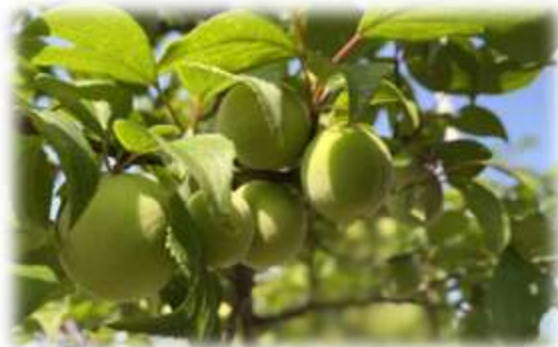
たわわに実をつけた梅

そんな6年生の姿は修学旅行後の掃除の時間にも垣間見ることができました。ある教室では、掃除時間が始まるとすぐに役割分担を6年生がしていました。そして、時折「次はこれでしょうか」と指示を出しつつ、自分の掃除分担である教室の下拭きを一生懸命進める6年生の姿がそこにありました。それを見ていたのか、低学年の子たちが何も言わなくても自分の役割を黙々と進める姿が見られました。これぞ高学年の姿勢だと感じました。また、その姿をしっかりと低学年は見て学んでいるのです。よい行動はつながっていくのだなあと感じました。まさに「率先垂範」です。自分がいい姿を見せて、ほかの子たちがそれに学ぶ。リーダーの姿だなあと思いました。こういった姿をまた、次のリーダーが学んでいってくれるのだらうと思うと頼もしいです。6月も地域、保護者の皆様のご支援をよろしくお願いいたします。