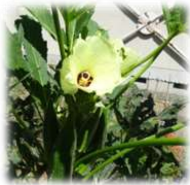
学級園のオクラの花