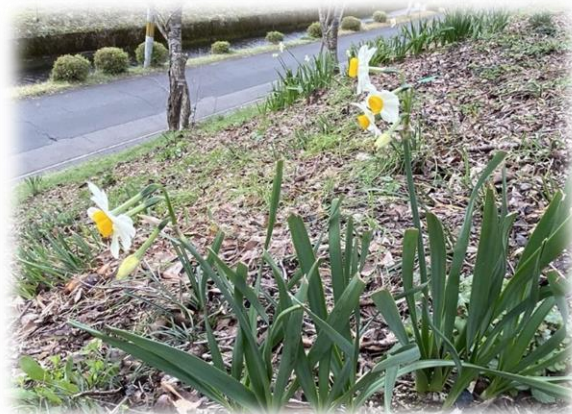
桜木丘土手のニホンスイセン