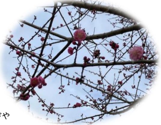
日に日に花開く昇降口前の紅梅