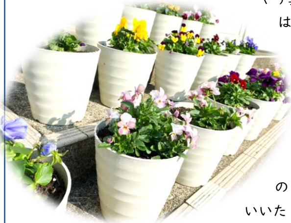
花いっぱい運動でのパンジーやビオラ

やり算は、由良川っ子は、得意な人がたくさんいそうです。時には、自分のことで精一杯で相手のことを忘れてしまいがちなこともあります。そんな時はみんなで話し合っただうしたらよいかを考えていけばよいのです。自分だったらどうだろうか、自分ならどんなことができるだろうかなど、自分自身を振り返って考えて行動できると素敵ですね。自分も相手も大切にするために、思いやり算を得意になって笑顔がいっぱいの学校にしたいと思います。12月も地域の皆様、保護者の皆様の温かいご支援とご協力をよろしくお願いいたします。